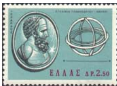
HIPARCO DE RODAS 190 A.C. - 120 A.C.