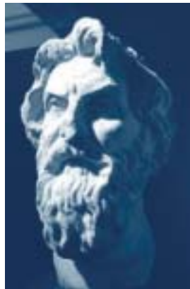
ARISTARCO DE SAMOS H. 310 A.C. H. 230 A.C.