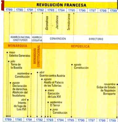
Eje cronológico de la Revolución Francesa (1789-1799)