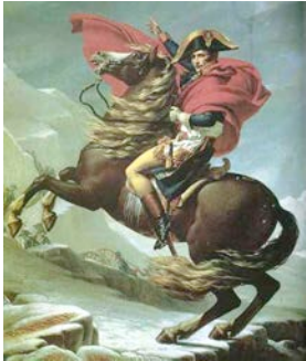
Napoleón como general victorioso