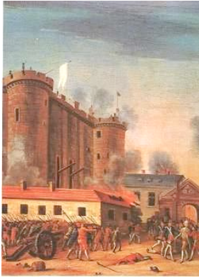
Cuadro que representa la Toma de la Bastilla el 14 de julio de 1789