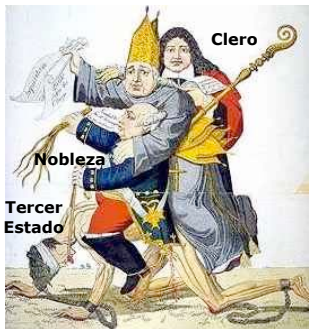
El Tercer Estado oprimido por los privilegiados