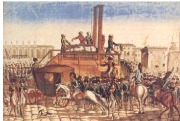
Ejecución de Luis XVI en la guillotina